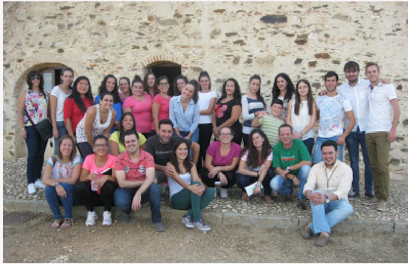
Foto: Grupo de jóvenes participantes en la convivencia

A lo largo de este fin de semana, el grupo joven de la Hermandad de San Benito Abad, ha realizado una convivencia, en la ermita del patrón, con el fin de crecer como grupo humano y cristiano.